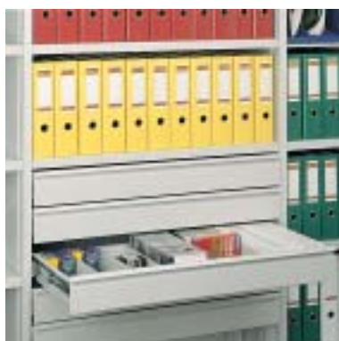
Schublade für Disketten und CD-Roms