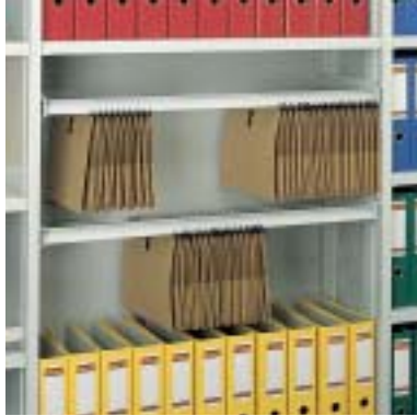
Hängerahmen lateral für DIN A4