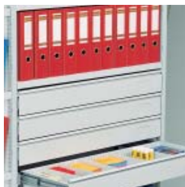
Schubladen für Kleinmaterial