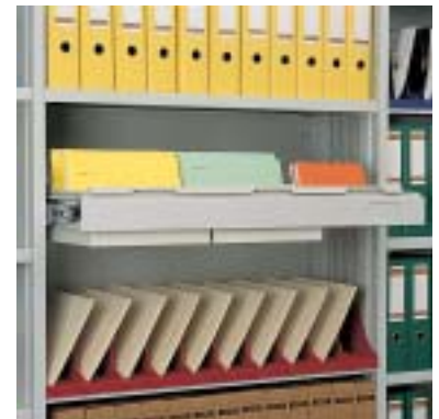
Hängeauszug für Karteikästen; Stehsammler