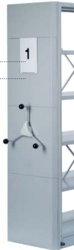
geschlossener Rahmen ungelocht